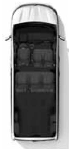
Konfiguracija s 6 sjedala