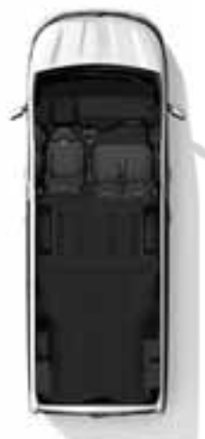
Konfiguracija s 3 sjedala