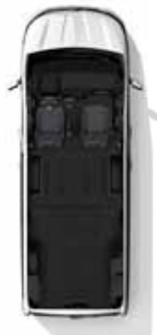
Konfiguracija s 2 sjedala