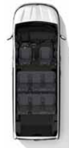
Konfiguracija s 8 sjedala