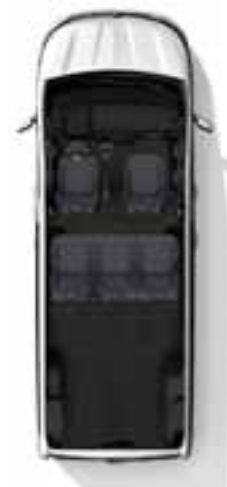
Konfiguracija s 5 sjedala