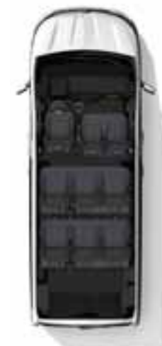
Konfiguracija s 9 sjedala