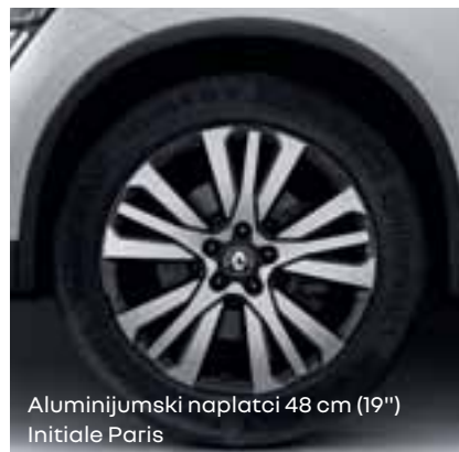
Aluminijumski naplatci 48 cm (19") Initiale Paris