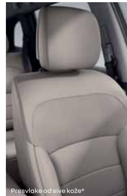
Presvlake od sive kože*