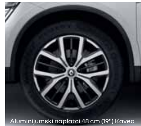
Aluminijumski naplatci 48 cm (19") Kavea