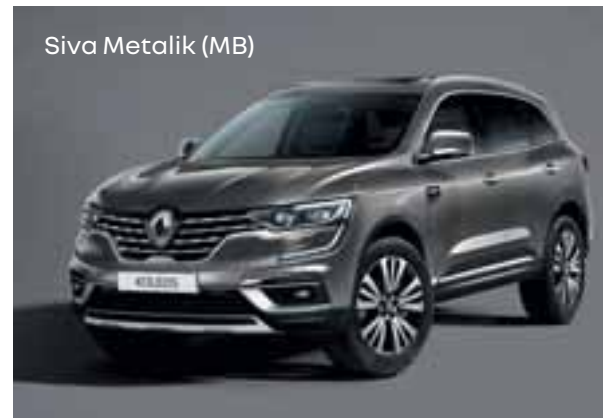
Siva Metalik (MB)