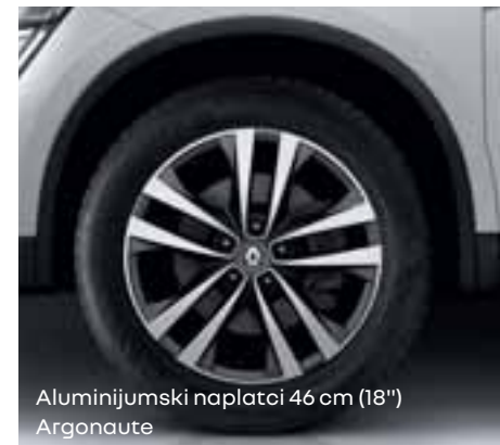
Aluminijumski naplatci 46 cm (18") Argonaute