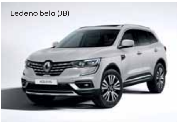
Ledeno bela (JB)