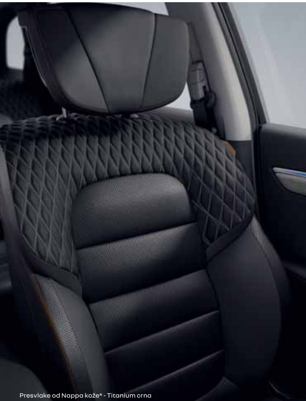
Presvlake od Nappa kože* - Titanium crna