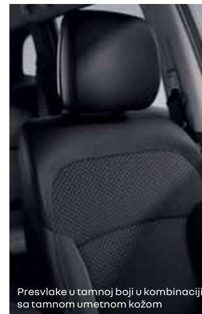
Presvlake u tamnoj boji u kombinaciji sa tamnom umetnom kožom

* Sva kožna sedišta navedena u ovom dokumentu delimično su presvučena pravom kožom, a delimično tkaninom sa zaštitnim materijalom. Detaljne informacije o korišćenim materijalima možete dobiti od svog prodajnog savetnika.