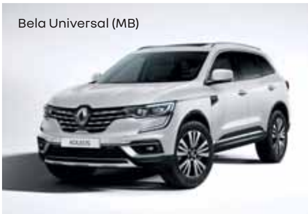
Bela Universal (MB)