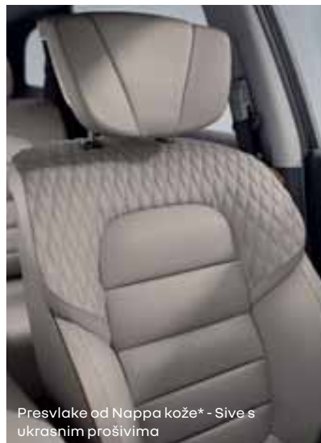
Presvlake od Nappa kože* - Sive s ukrasnim prošivima