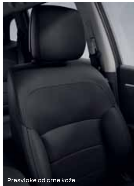
Presvlake od crne kože