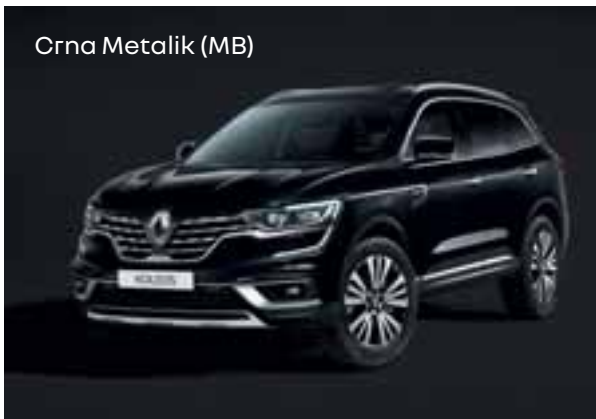
Crna Metalik (MB)