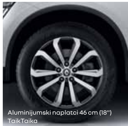
Aluminijumski naplatci 46 cm (18") TaikTaika