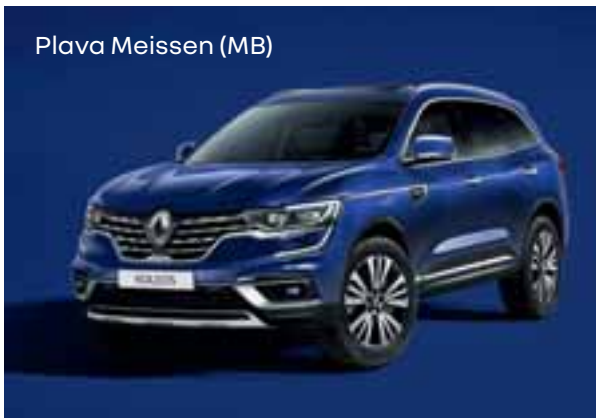
Plava Meissen (MB)