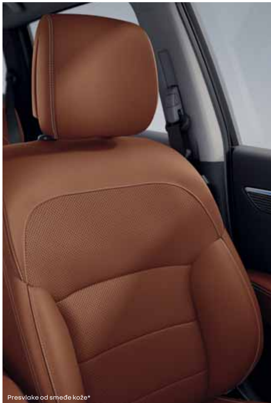
Presvlake od smeđe kože*