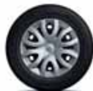
Ukrasni pokrovi kotača 15" Paradise