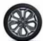
17" Optemic - Kromirani i sivi