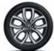
16" Pulsize - Sivi