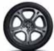
16" GT Line