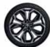
17" Optemic - Kromirani i crni