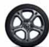
17" GT Line