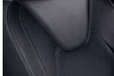
Presvlake u kombinaciji umjetne kože i svijetlosive boje