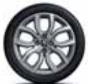
16" Pulsize - Srebrni