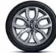
Aluminijski naplatci 16" Pulsiz - srebrni