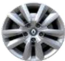
Ukrasni poklopci točkova Flexwheel 16"