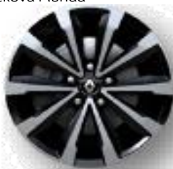
Aluminijumske felne 17" Monthlery