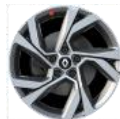
Aluminijumske felne 18" Magny Cours