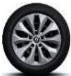
Čelični naplatci 16" s ukrasnim poklopcima točkova Florida

S = Serija O = Opcija - = Nije dostupno P = Paket