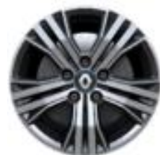
Aluminijumske felne 16" Siva Impulse