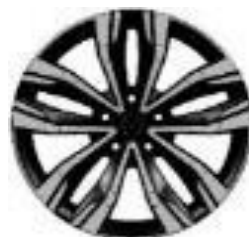
Aluminijumske felne 18" Hightek