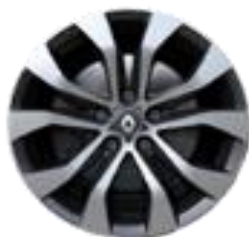
Aluminijumske felne 17" Allium