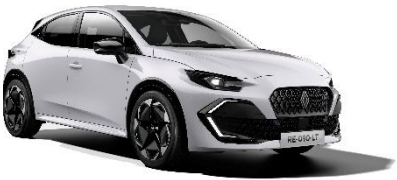
ledeno bijela (1)