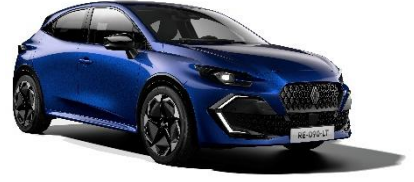
plava Iron (2)