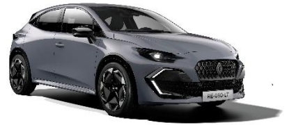
siva Rafale (2)