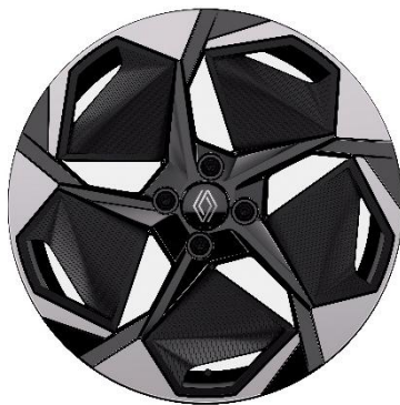
46-cm (18") aluminijski naplatci Rythmic