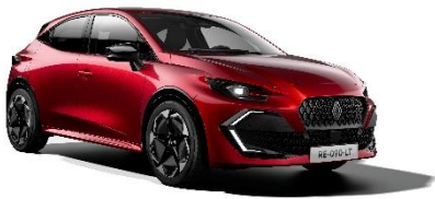
crvena Absolute (2)