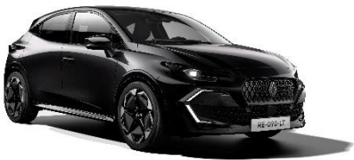
biserno crna (2)