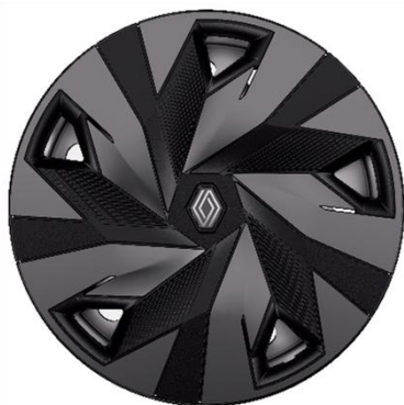
čelični poklopci 41 cm (16") Synchro