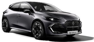
siva Schiste (2)