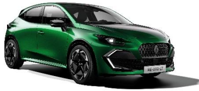
zelena Absolute (2)