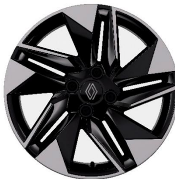
41-cm (16") aluminijski naplatci Dynamo