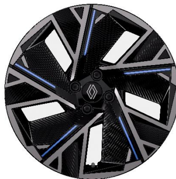
46-cm (18") aluminijski naplatci Cosmic