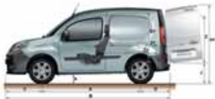
Kangoo Express Compact

VISINA, ŠIRINA, ZAPREMINA TOVORNOG PROSTORA... MINI VAN, KOJI SVOJIM DIMENZIJAMA ZADOVOLJAVA SVE VAŠE POTREBE.