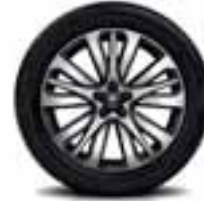
Aluminijumski naplatci INITIALE PARIS 19"