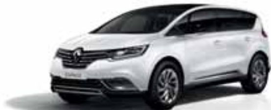
Ledeno bela (JB)