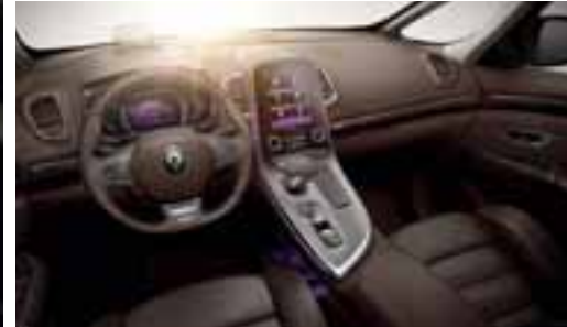
Unutrašnjost Initiale Paris u boji Smeda Fonce