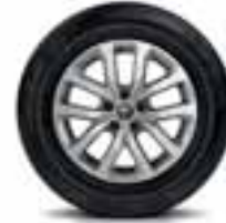
Aluminijumski naplatci 17" aquilai