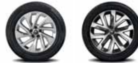
Aluminijumski naplatci 18" lapaiz