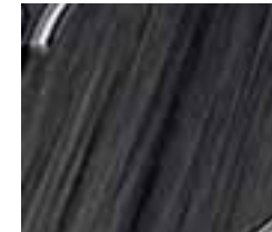
Dekoracija Silver Wood