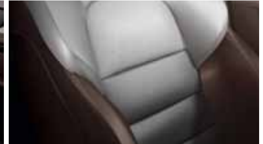
Dvobojna sedišta u Nappa koži - Camaieux Siva