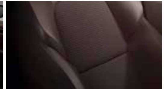
Sedišta u kombinaciji veštačke kože i tkanine - smeđa Fonce