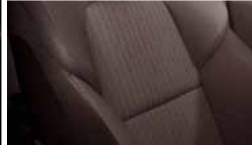
Sedišta presvučena tkaninom - smeđa Fonce