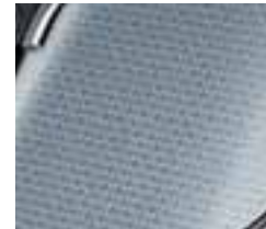
Dekoracija INITIALE PARIS