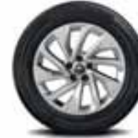
Aluminijumski naplatci 18" lapiaz*