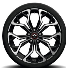
Aluminijske felne 19" Diamond