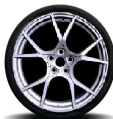
Aluminijske felne 19" Trophy Forgee