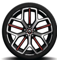
Aluminijske felne 19" Trophy Akio