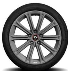
Aluminijske felne 18" Estoril