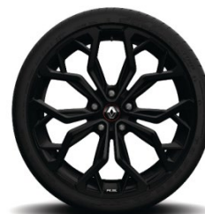
Aluminijske felne 19" Diamond Black