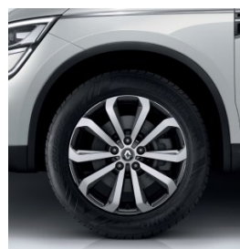
Aluminijske felne 18" Taranis