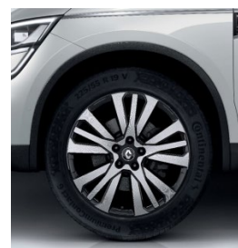
Aluminijske felne 19" Initiale Paris