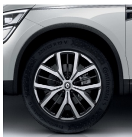
Aluminijske felne 19" Proteus